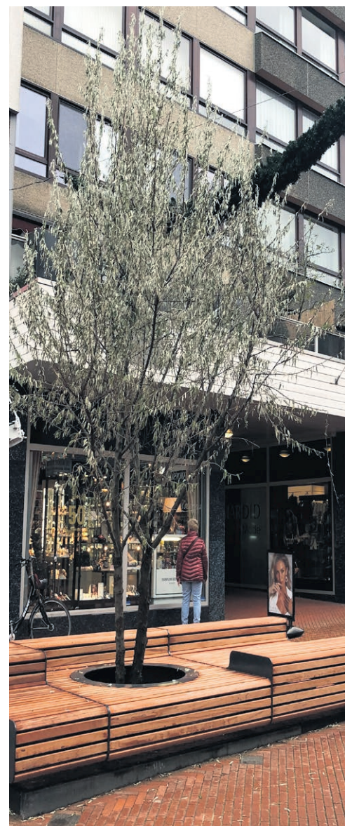
Heeft u het al gezien? In het centrum van Brunssum staan mooie nieuwe banken. In dit exemplaar is zelfs een boom verwerkt. Deze Olijfwilg ziet er nog een beetje "geschrokken" uit door het overplanten. In de winter verliest hij zijn blaadjes, maar in het voorjaar wordt hij weer mooi groen.

Iedere vier jaar komen dansers van over de hele wereld naar Brunssum en dat al sinds 1953. Een rijke traditie die draait om het (her)ontdekken van de internationale traditionele folklore. De Parade 2020 legt een extra accent op het ontwikkelen van nieuwe dansvormen door samensmelting van traditionele groepen en hedendaagse dansers.