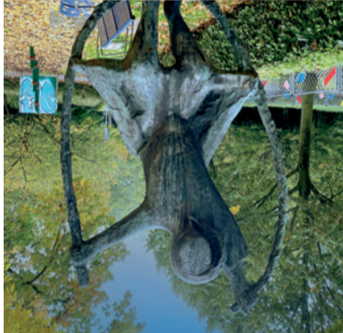
3. Veteranenmonument Ivo Rosbeek, 2023. Het monument is een eerbetoon aan alle Nederlandse en internationale veteranen die zich, nu en in het verleden, inzetten voor vrede en veiligheid, waar ook ter wereld.